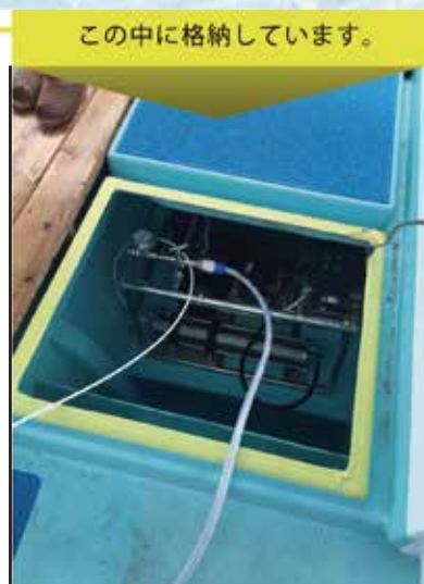
この中に格納しています。