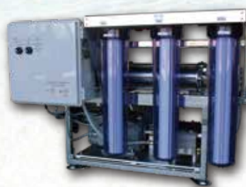
小型海水淡水化装置 MYZ E-250