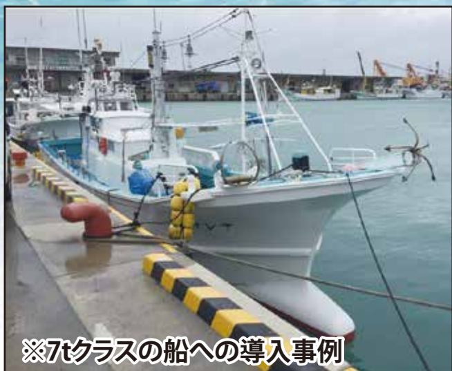
※7tクラスの船への導入事例